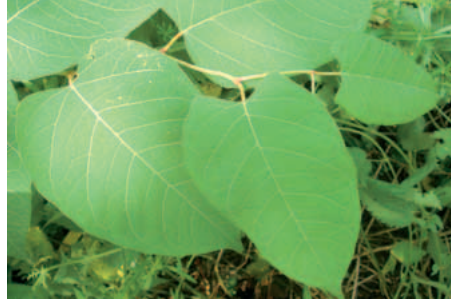
Reynoutria x bohemica