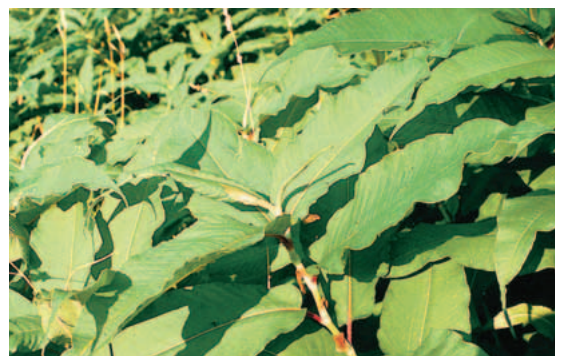
Himalaja- oder Vielähriger-Knöterich

Der Vielährige Knöterich stammt aus dem Himalaja und unterscheidet sich im Aussehen deutlich von den oben genannten Arten. Er wird nur 1–2 m hoch, sein bis 30 cm langes Blatt ist länglich, schmal und spitz zulaufend. Er ist in der Schweiz verbreitet, wenn auch deutlich seltener als der Japan-Knöterich.