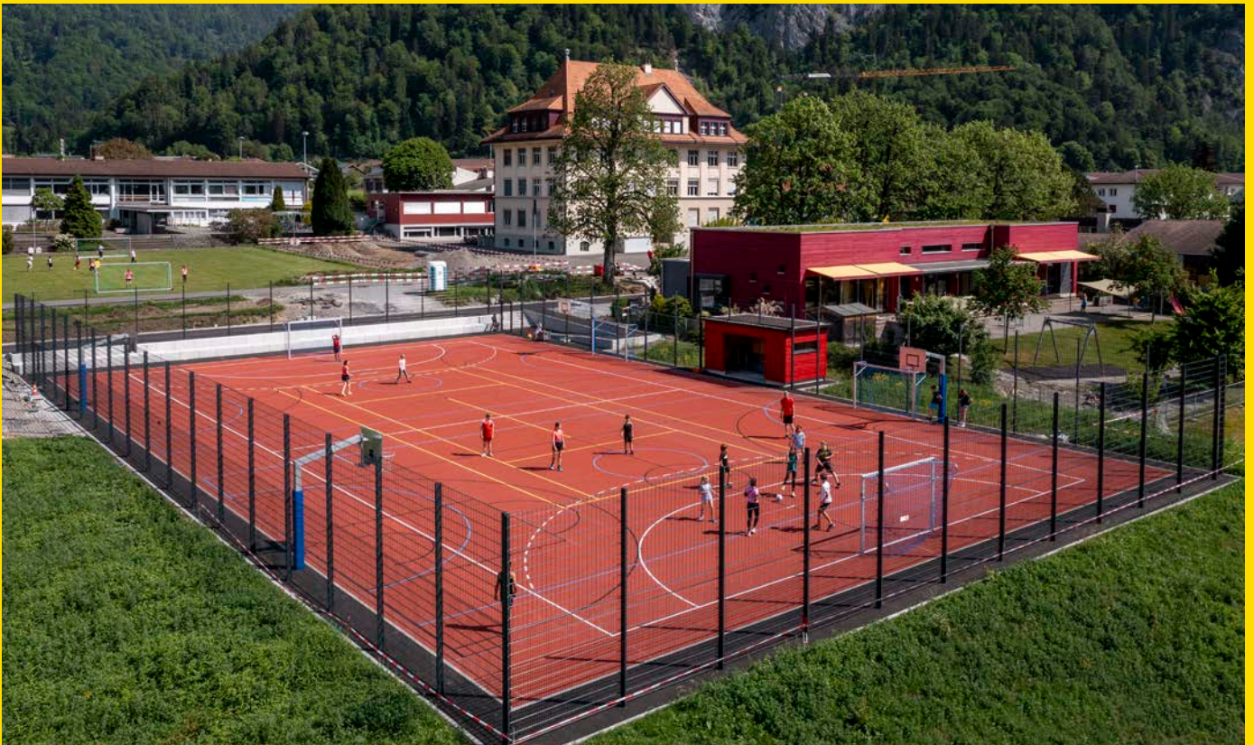
Der neue Allwetterplatz beim Schulhaus wird rege genutzt.