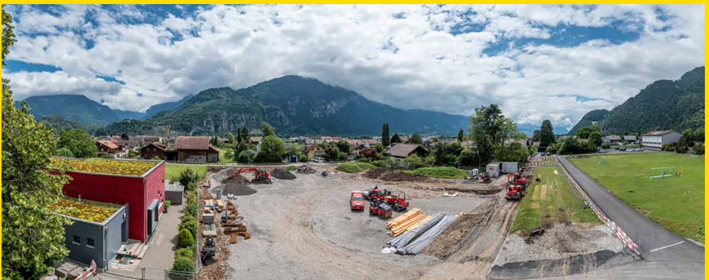
Luftaufnahme Baustelle Aussenraumgestaltung Schulhaus

Wir wünschen Ihnen einen goldenen Herbst. Gemeinderat Unterseen