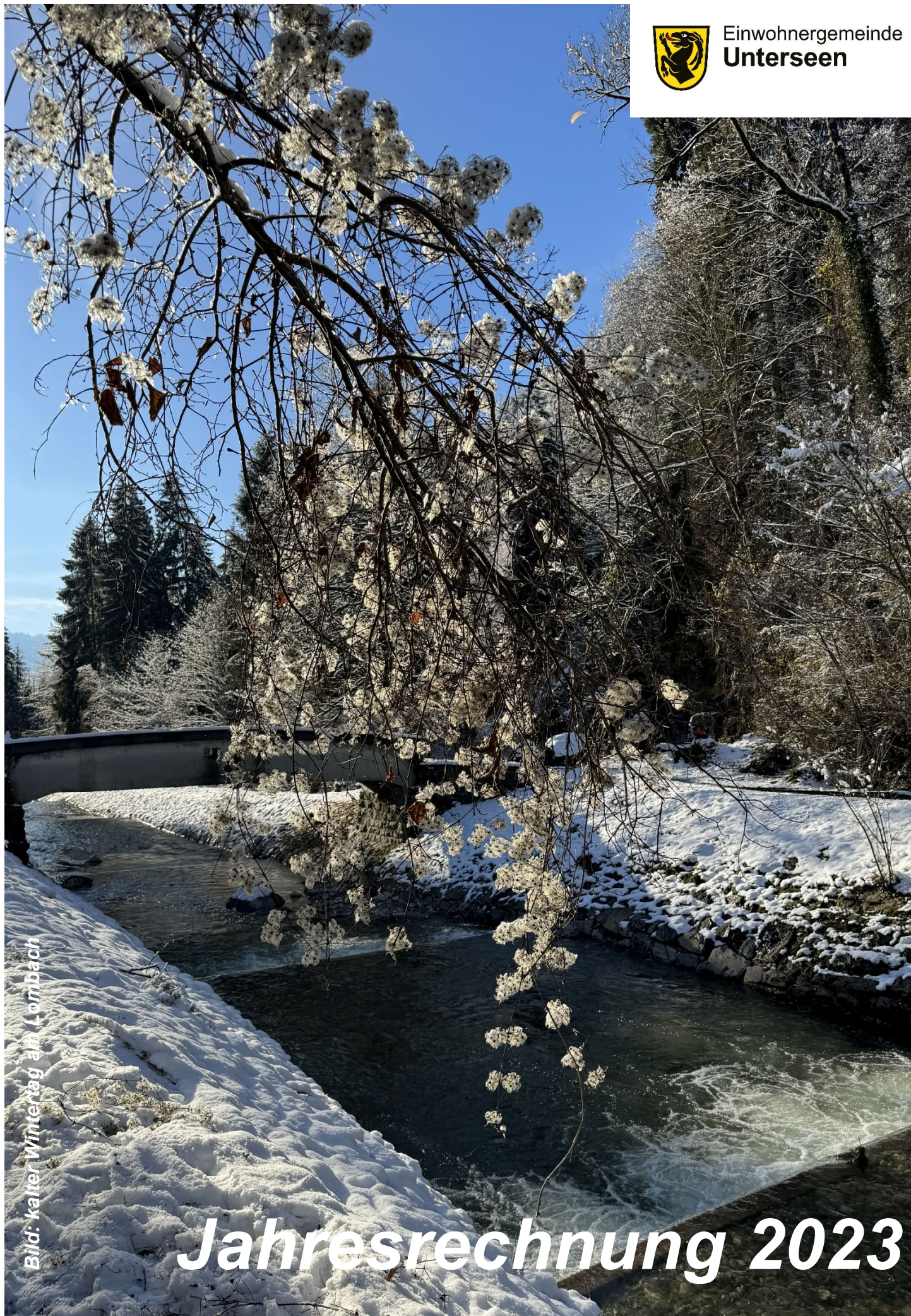
Bild: kalter Wintertag am Lombach