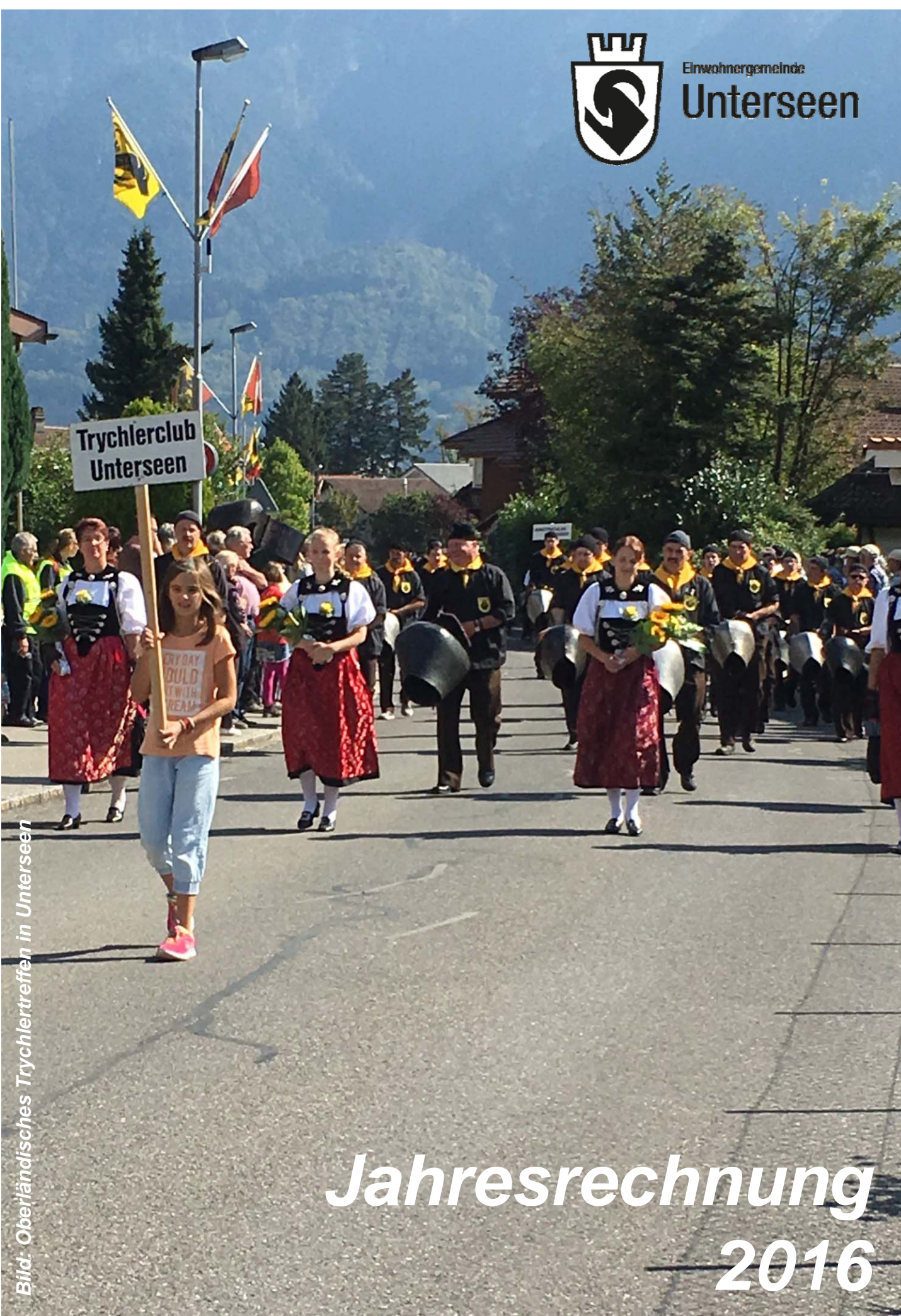
Bild: Oberländisches Trychlerreffen in Unterseen